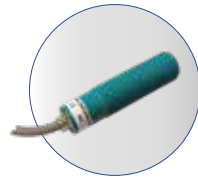
WEARwatcher MPU Integrierte Analyseeinheit mit Beschleunigungssensor Art. Nr. 450442